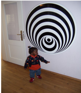
Drehende Scheibe Auf

Zahlreiche Projekte wurden bisher durch Spendenmittel des Freundeskreises ermöglicht, wie die Gestaltung der 1. Etage im Hauptgebäude des Kinderzentrums St. Josef mit Spielelementen aus dem Bereich der Sinneswahrnehmung.